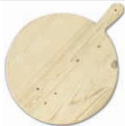
Taglieri polenta con manico

In faggio, spessore mm.20 con supporti inferiori