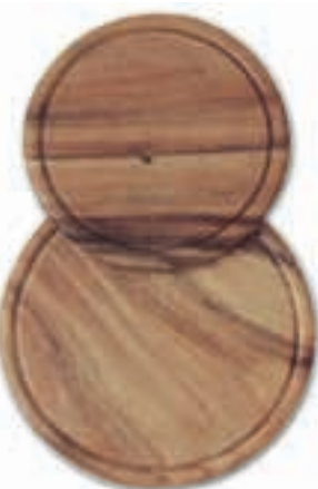
Piatto salumi legno