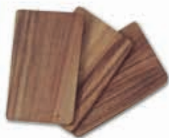
Set 3 pezzi taglieri panini rettangolari