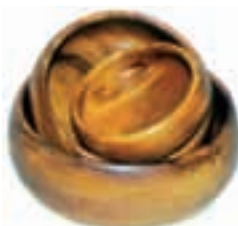
Ciotole in legno