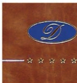
Stampa a caldo argento e serigrafia blu