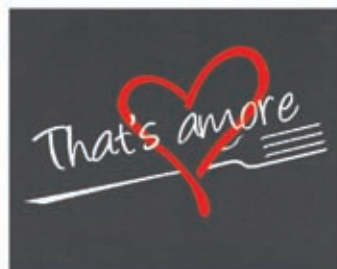
Serigrafia a 2 colori