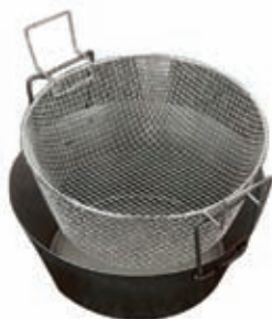
Friggitrici con cesto