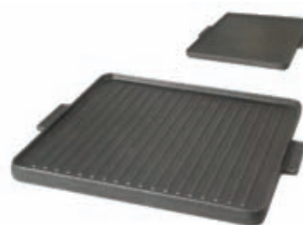
Griglia in ghisa per cucina 351