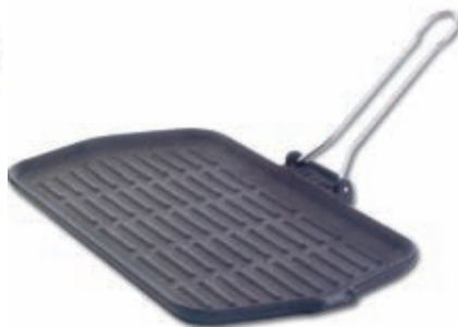
Bistecchiera "DIETELLA" 205