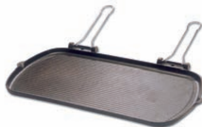
Bistecchiera "MAXIDIETELLA" 208