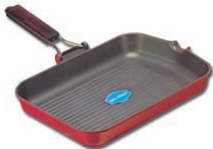
Bistecchiera "LA GHIOTTA"

In alluminio con rivestimento antiaderente