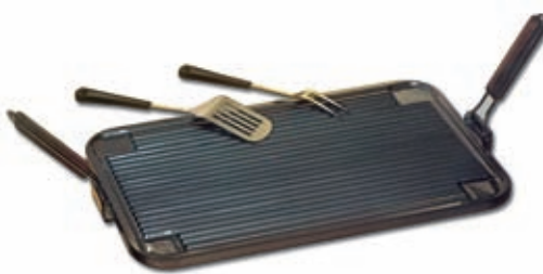
Piastra professionale "LA GHIOTTA" 031

In alluminio con rivestimento antiaderente