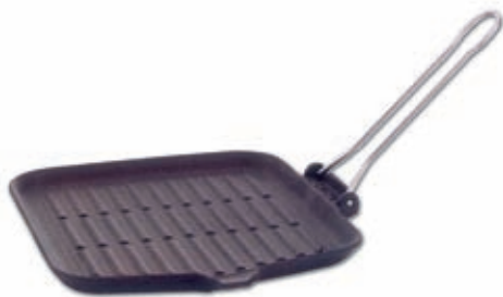
Bistecchiera "DIETELLA" 200