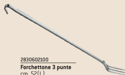
2830602100 Forchettone 3 punte cm. 52(L)