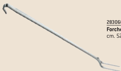
2830602200 Forchettone 2 punte cm. 52(L)