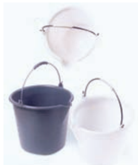
Secchio con becco pesante in PE LD