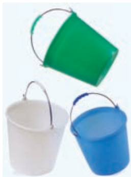
Secchio senza becco in PE LD