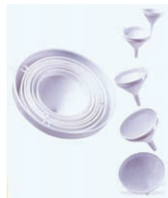
Imbuto in PP