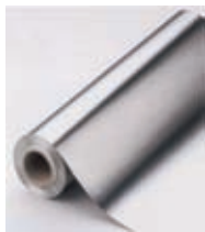
Rotoli in alluminio