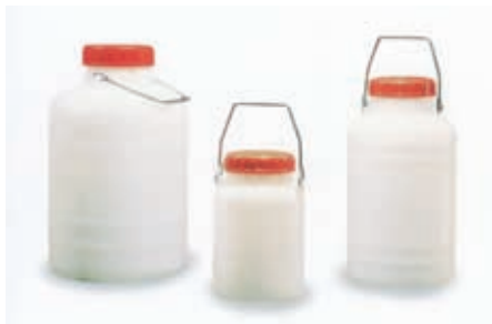
Bidone collo largo in PE HD