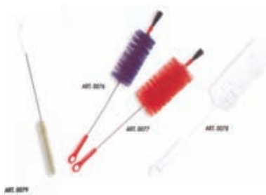
Lavabottiglie, lavabiberon e scovolini