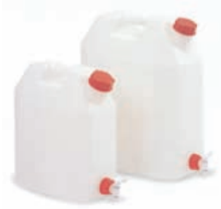
Tanica con rubinetto in PE HD