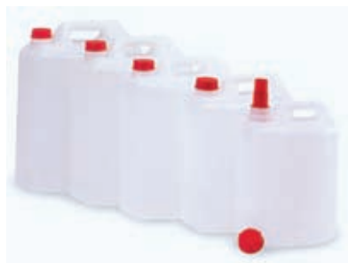
Tanica normale in PE HD