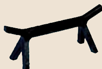
2856940000 Alare poggialegna in ghisa cm.40