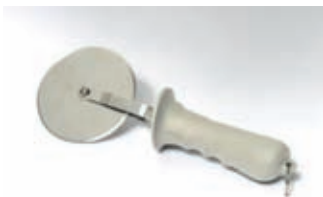
2856600000 Rotella tagliapizza cm.10 Inox, manico in PP rinforzata per uso intensivo