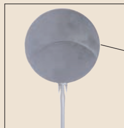
Particolare piatto pala per cuocere rinforzato