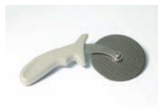
2856600100 Rotella tagliapizza cm.10 Inox, manico in PP rivestimento antiaderente