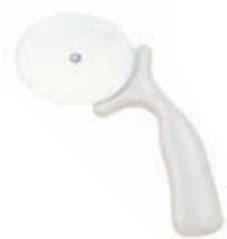
2515510000 Rotella tagliapizza cm.6,5 Inox, manico in plastica Modello economico