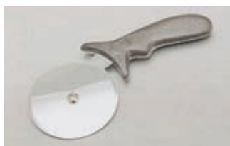
2646010000 Rotella tagliapizza cm.10 Inox, manico in plastica