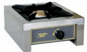
4483000000 Fornellone GAR7

Telaio inox, termocoppia di sicurezza, corona bruciatore e placca inox lavabili in lavastoviglie. Potenza 7 Kw Dimensioni cm.35x51x18h.