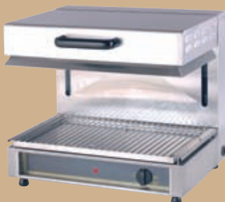
4427001000 La salamandra SEM60

Regolabile al millimetro. Due zone di riscaldamento indipendenti o piena potenza. Parte superiore mobile. Altezza massima utile cm.26. Monofase 230V 2800W Dim.cm. 60x57x54,5h.