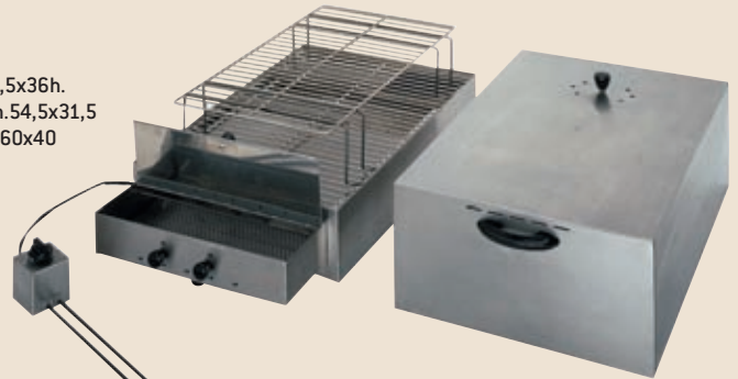
4428003000 L'affumicatore FM4

Segatura speciale 3300024895 In sacchetti da 500 gr. 10 sacchetti di segatura