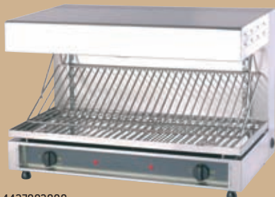
4427003000 La salamandra SEF80

Cremagliera a 4 livelli. 4 zone di riscaldamento indipendenti o piena potenza. Piatto inferiore mobile con griglia. Altezza massima utile cm.26. Trifase 230/380V 4400W Dim.cm.80x45x54,5h.