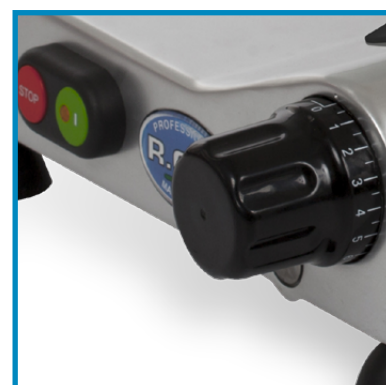
Manopola graduata ed interruttore per centralina CEV. Graduated knob and switch linked to CEV control unit.