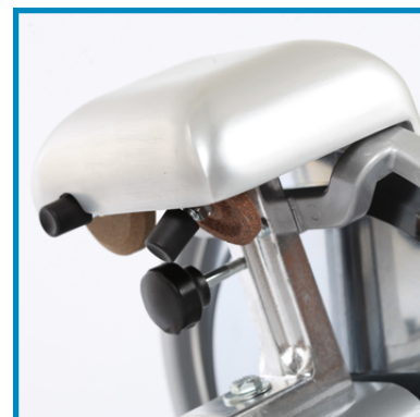
Affilatoio fisso. Fixed sharpener.