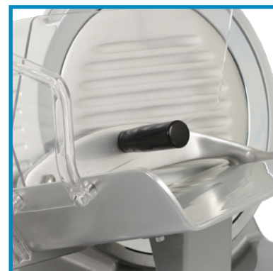
Pressamerce con protezione in plexiglass. Food-holder arm with protection in plexiglass.