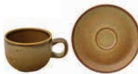
9536 TAZZA CAFFÈ cl 9,5 9537 PIATTINO PER TAZZA CAFFÈ