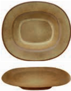
9528 PIATTO FONDO CON FALDA cm 24x21