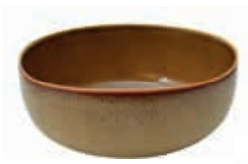
9529 INSALATIERA cm 17x15