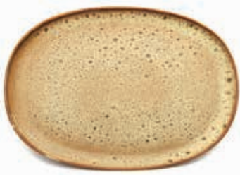
9531 VASSOIO cm 33x23