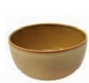
9530 COPPETTA Ø cm 13,5