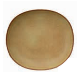
9535 PIATTO FONDO cm 26x23