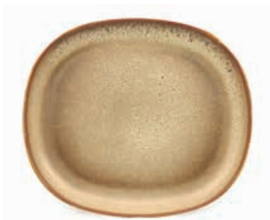
9525 PIATTO PIANO cm 33,5x29,5 9526 PIATTO PIANO cm 28,5x25 9527 PIATTO FRUTTA cm 23x20

Le eventuali imperfezioni estetiche non sono da considerarsi un difetto ma una peculiarità della lavorazione manuale